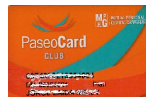
(credencial color naranja)