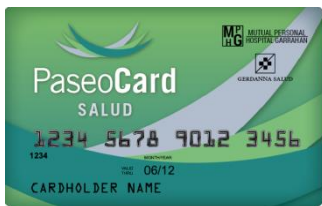
(credencial color verde)