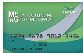
(credencial color verde)