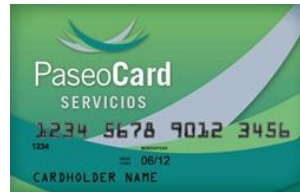
(credencial color verde)