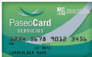
(credencial color verde)