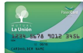
(credencial color verde)