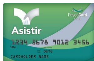
(credencial color verde)