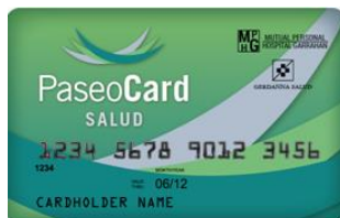
(credencial color verde)