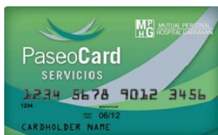
(credencial color verde)