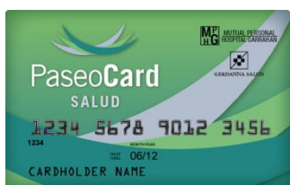
(credencial color verde)