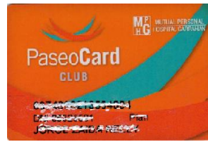
(credencial color naranja)