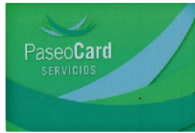
(credencial color verde)