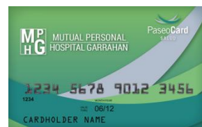
(credencial color verde)