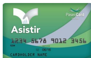
(credencial color verde)