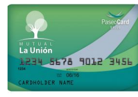
(credencial color verde)