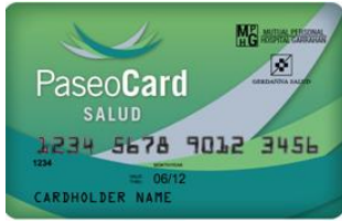
(credencial color verde)